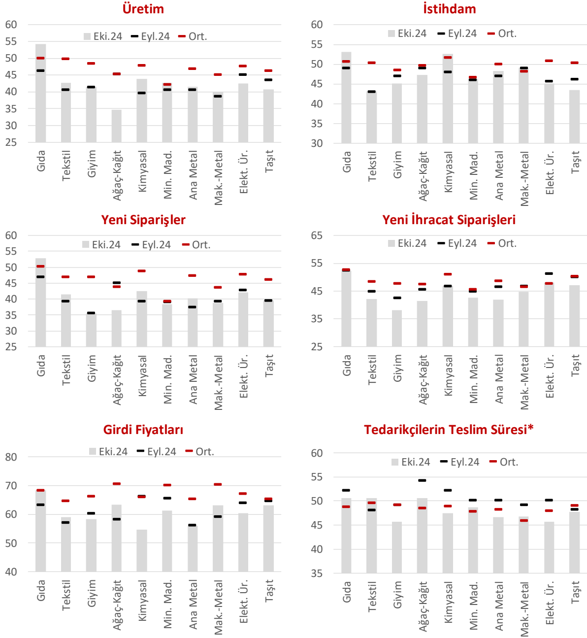
Grafik 3. Sektörlere göre PMI Alt Endeksleri (mevsimsellikten arındırılmış, seviye)